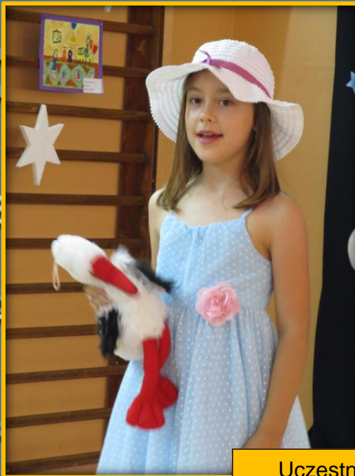
Uczestnicy konkursu recytatorskiego.