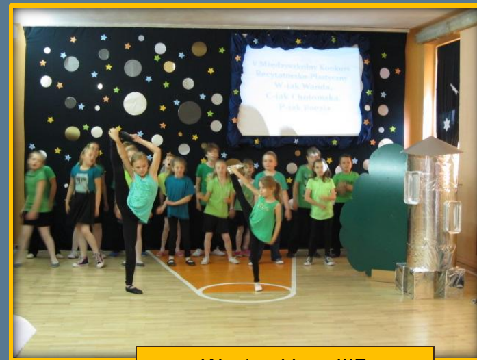
Występ klasy IIIB