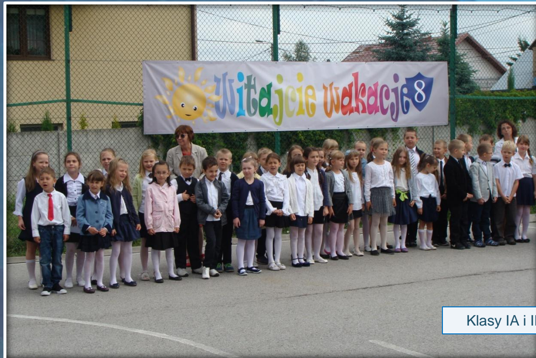
Klasy IA i IB