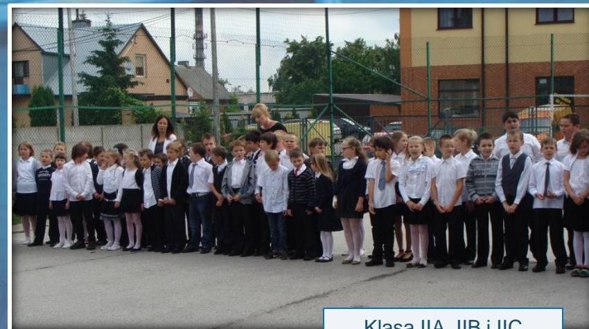
Klasa IIA, IIB i IIC