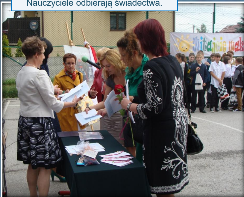
Nauczyciele odbierają świadectwa.