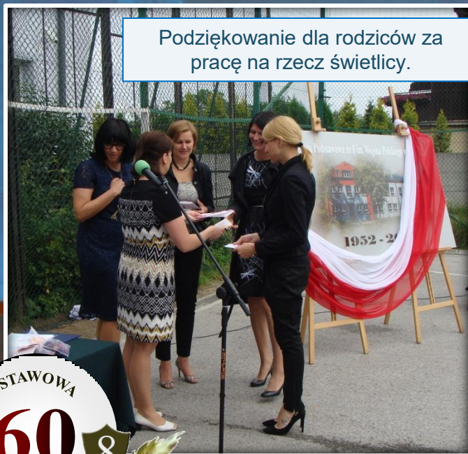
Podziękowanie dla rodziców za pracę na rzecz świetlicy.