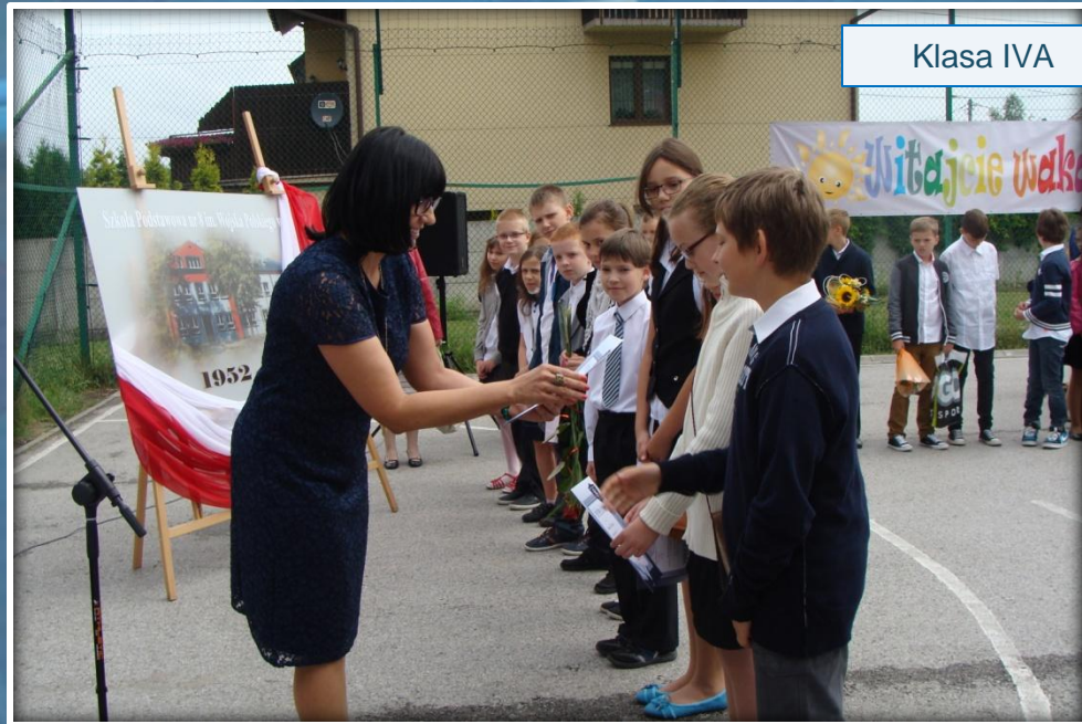
Najlepsi uczniowie klas IV-tych otrzymują dyplomy.