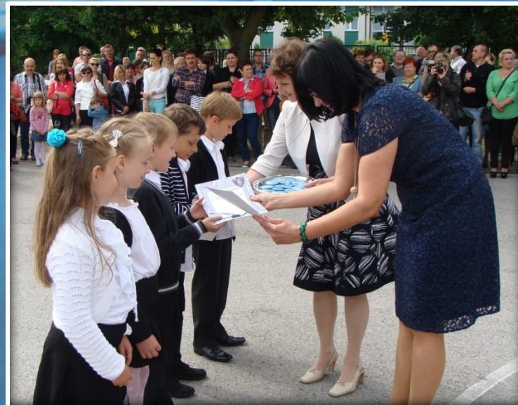
Wzorowi uczniowie klas młodszych otrzymują dyplomy i pamiątkowe plakietki.