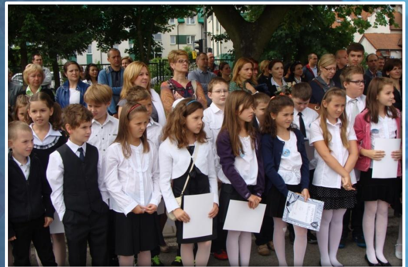
Klasy III po raz ostatni w gronie klas młodszych.