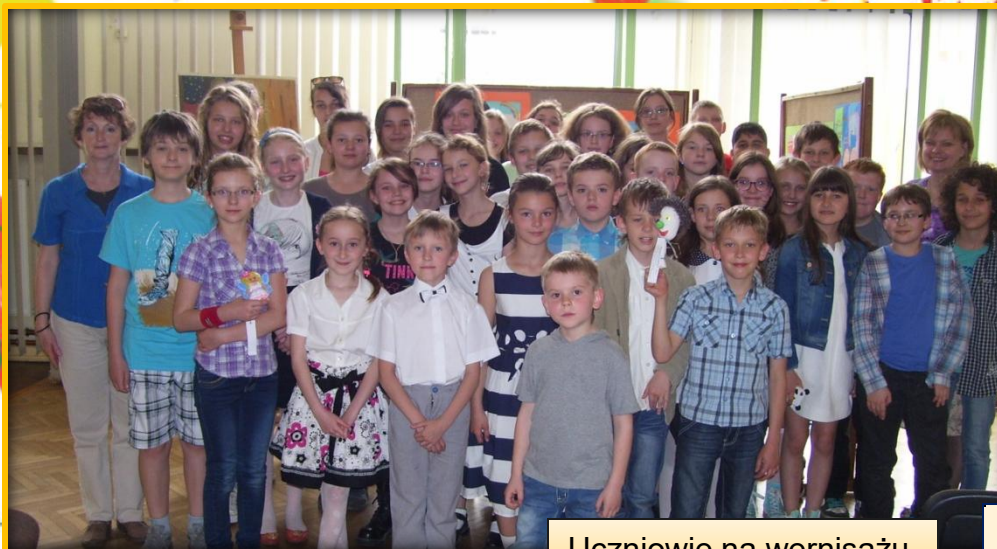
Uczniowie na wernisażu.