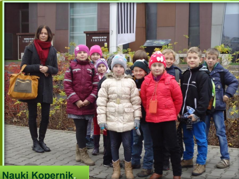
W drodze do Centrum Nauki Kopernik.