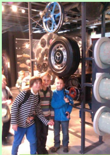
Zgłębianie zjawisk przyrodniczych w takim miejscu jest ciekawe.