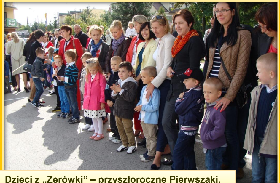
Dzieci z „Zerówki” – przyszłoroczne Pierwszaki.