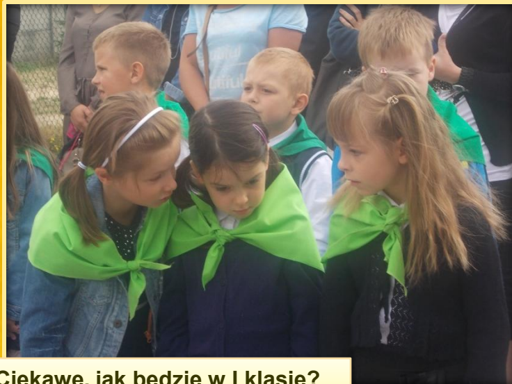
Ciekawe, jak będzie w I klasie?