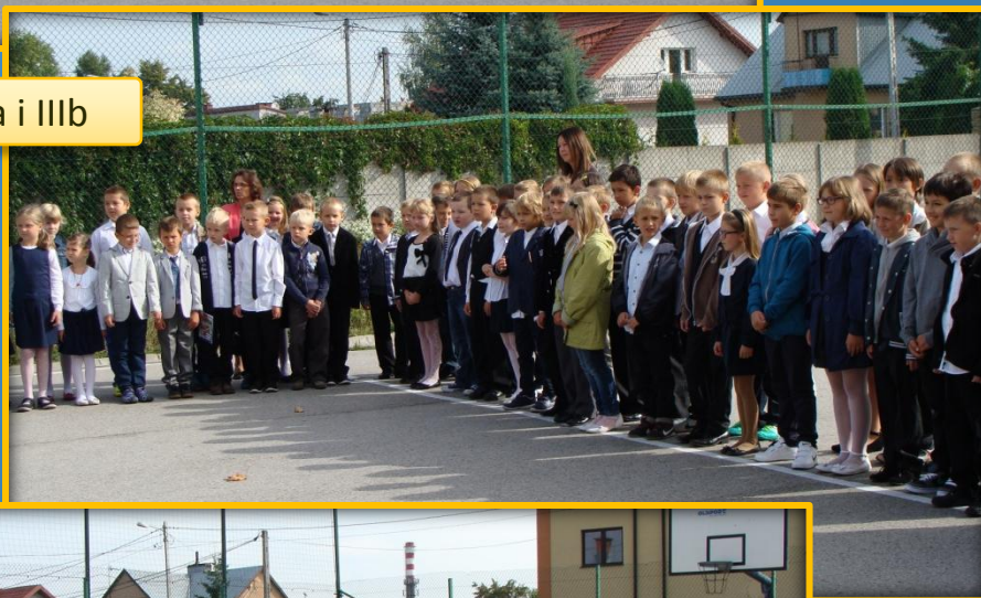
Klasy IIIa i IIIb