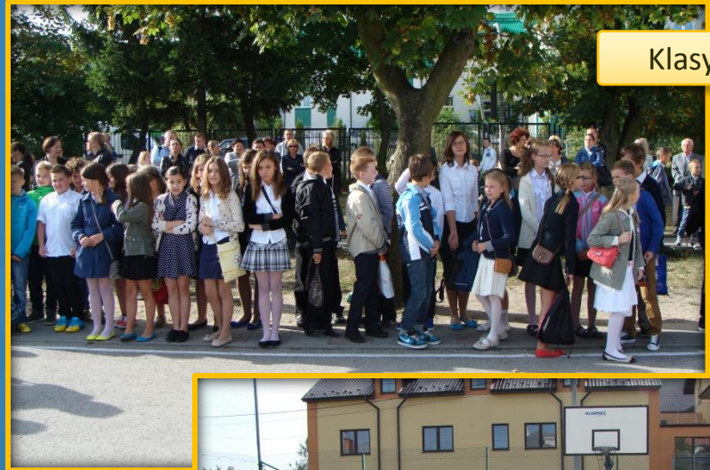
Klasy Va i Vb