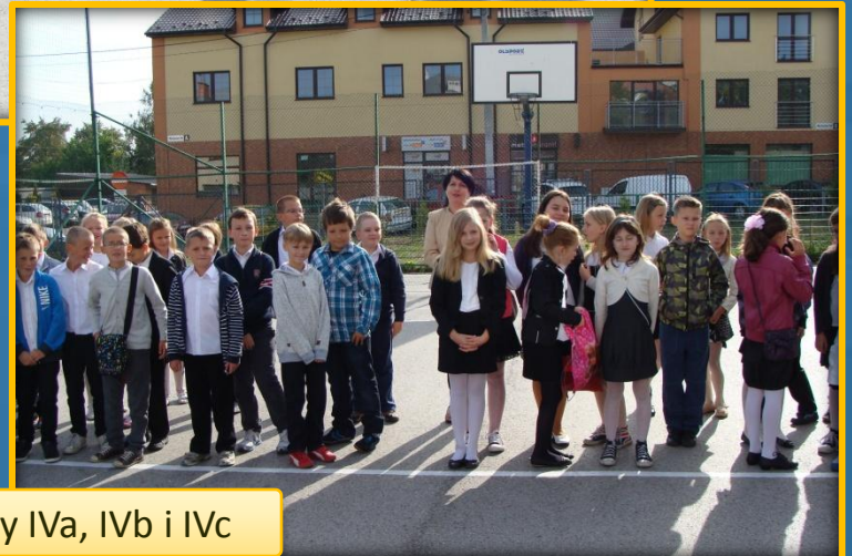
Klasy IVa, IVb i IVc