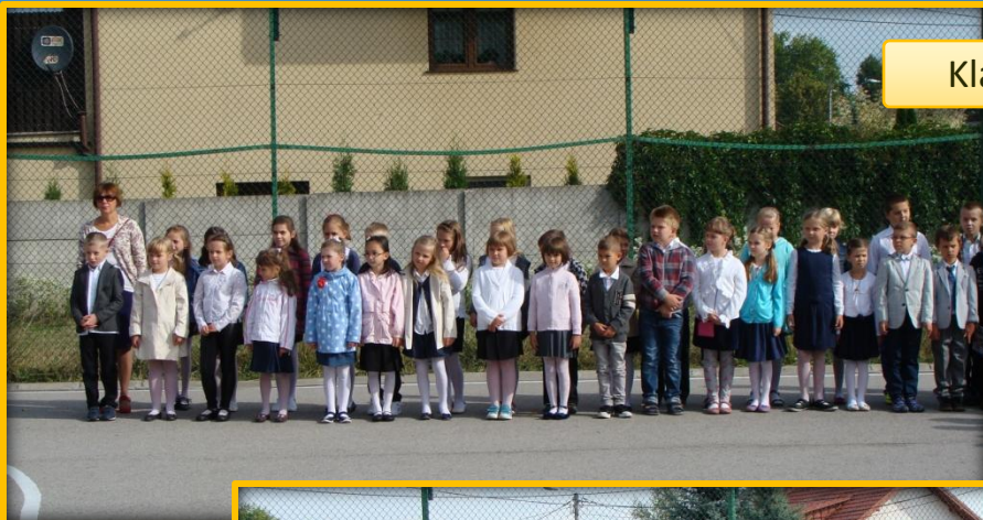
Klasy IIa i IIb