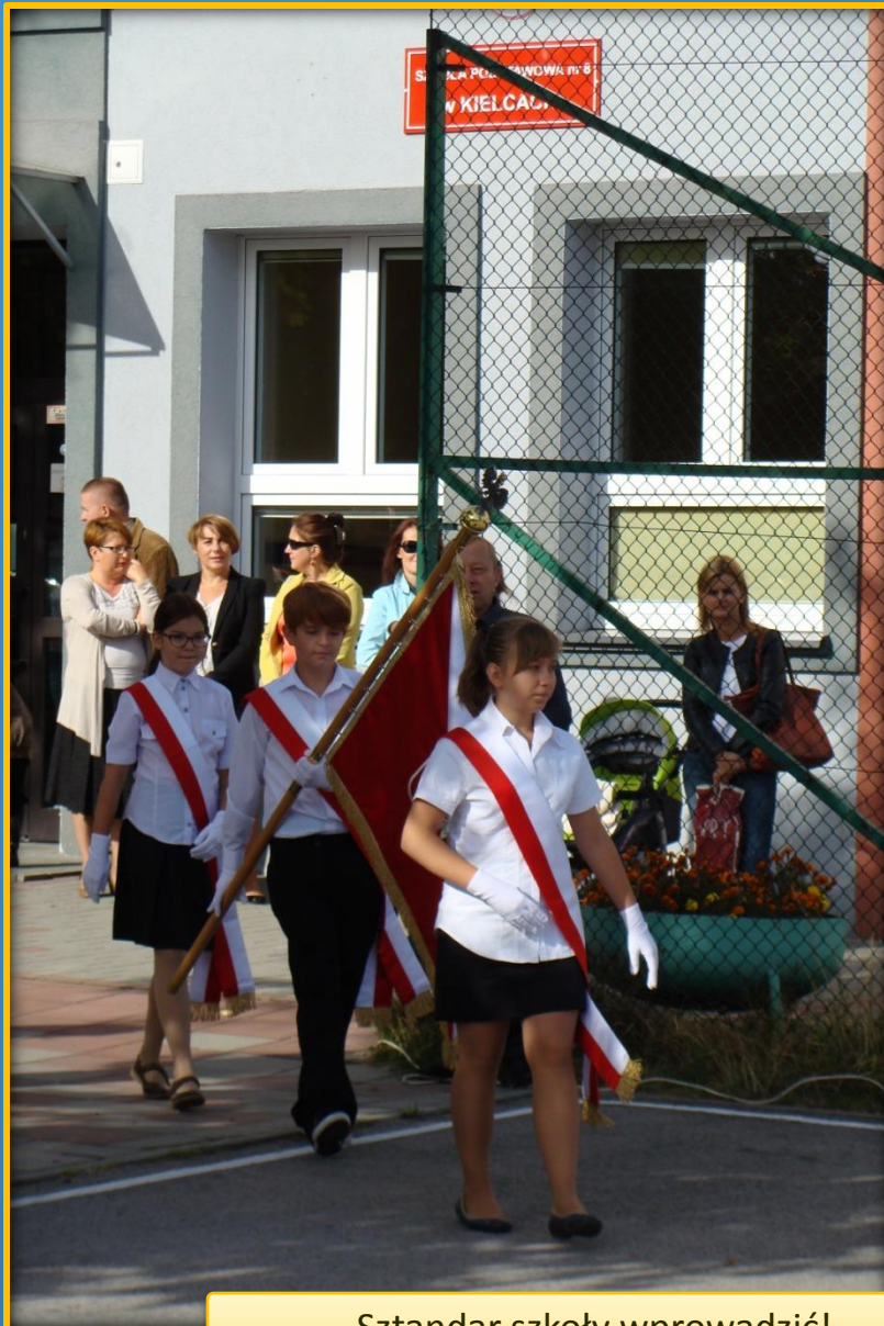
Sztandar szkoły wprowadzić!