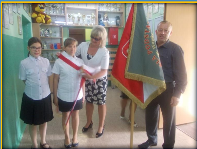
Przygotowania do rozpoczęcia roku szkolnego