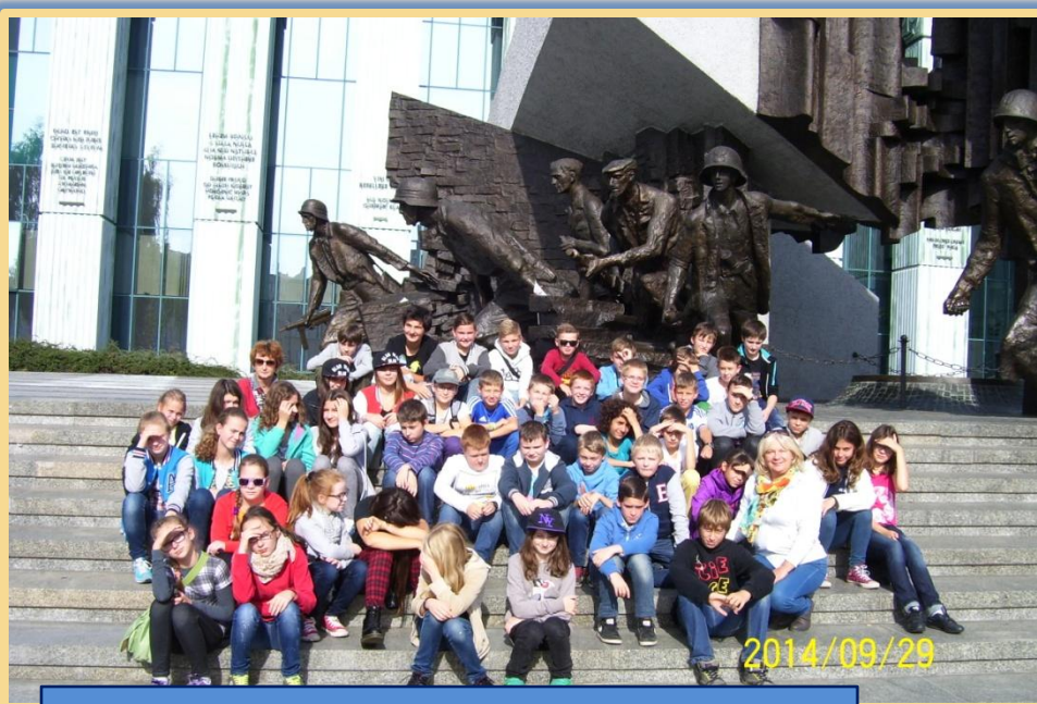
Przy pomniku Powstania Warszawskiego.