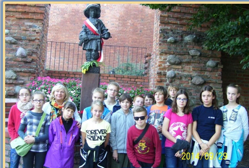
Przed pomnikiem Małego Powstańca

Wszystkich zachwyciły łazienki Królewskie , które w jesiennym słońcu prezentowały się naprawdę przepięknie.