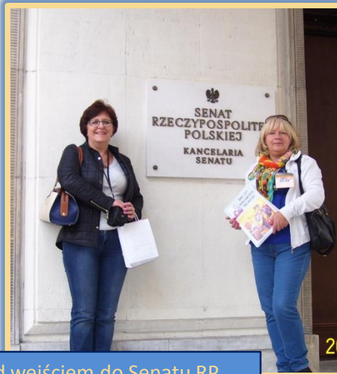
Przed wejściem do Senatu RP.