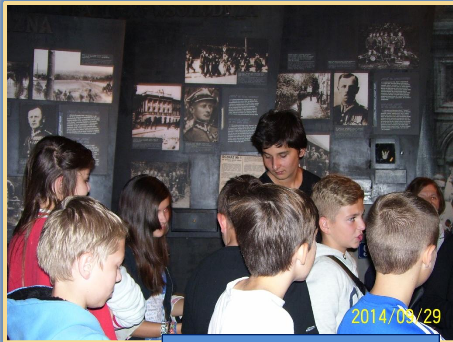
W Muzeum Powstania Warszawskiego.