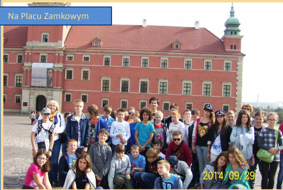
Na Placu Zamkowym