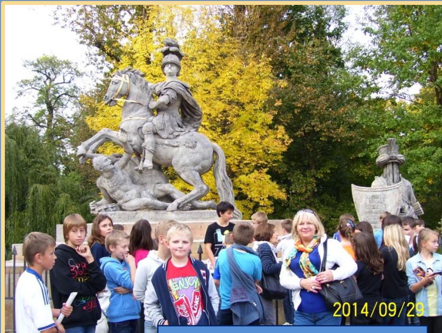
Przy pomniku króla Jana Sobieskiego.