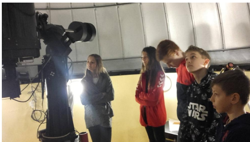
Przy odpowiedniej pogodzie można prowadzić obserwacje astronomiczne.