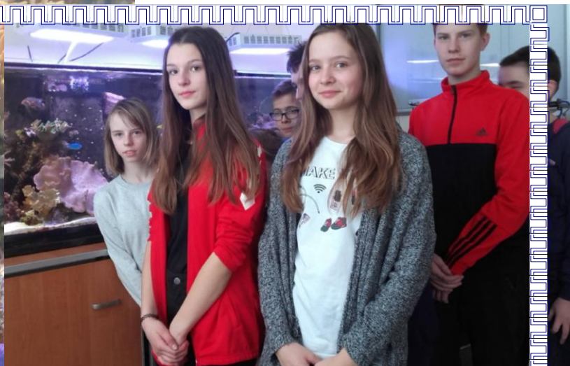
Rafa koralowa w akwarium morskim UJK