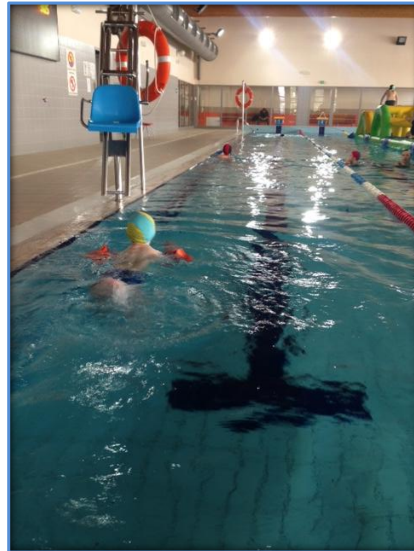
Szaleństwa na basenie.