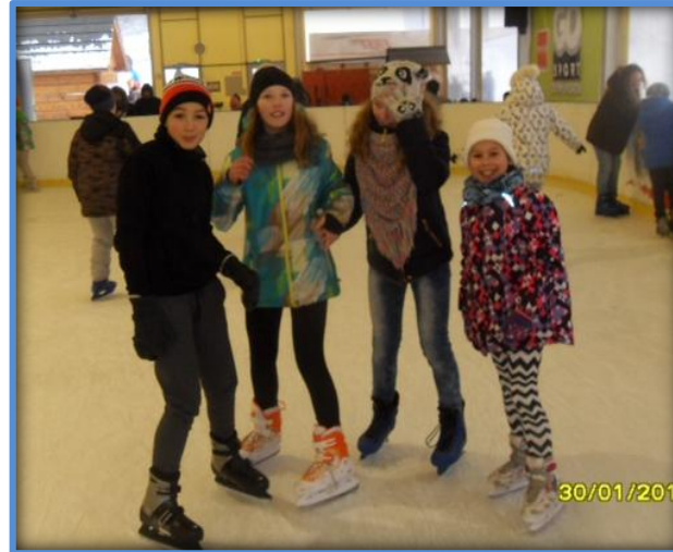
Szaletstwa na lodowisku i stoku narciarskim